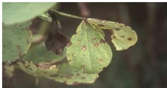
Figure 3 : Symptômes de la tache chocolatée sur féverole

La tache chocolatée est une maladie provoquée par le champignon responsable, Botrytis cinerea , présent dans le sol à l'état endémique. Il n'apparaît qu'en fin de cycle, à partir de la floraison et concerne principalement la fève et la féverole (Maladie principale de la culture). Il infeste les plantes à partir des taches de mildiou, de blessures (physique, piqûres d'insectes...) ou d'organes sénescents tels que les pétales fanés.