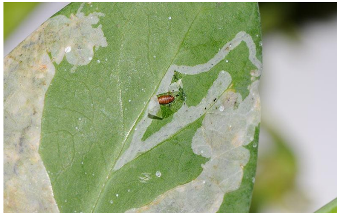
Figure 16 : Galerie causée par la mineuse de feuille au niveau de l'épiderme

Les feuilles attaquées par une mineuse brunissent, sèchent et finissent par tomber. Il en résulte un affaiblissement de la plante par défaut de photosynthèse. Il est rare que la plante parasitée soit détruite par les mineuses, mais elle devient plus sensible aux autres parasites et aux maladies cryptogamiques.