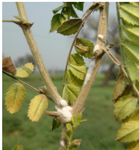
Figure 7 : Début d'infestation de la sclérotiniose sur pois chiche

La sclérotiniose cause d'énormes chutes de rendement et des refus de vente dû à la présence de sclérotés (organes de conservation de la maladie) dans la récolte. Cette maladie est due au champignon Sclerotinia sclerotiorum , qui se développe sur toutes les légumineuses et particulièrement le pois chiche.