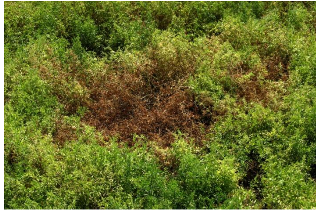
Figure 9 : Dommages de l'antracnose sur la lentille