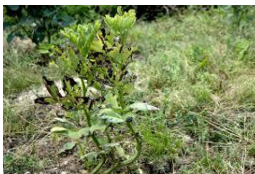
Figure 5 : Dégâts du Mildiou sur la culture de fève

L'attaque primaire (systémique) attaque les jeunes plantules qui deviennent naines, recroquevillées, couvertes d'un feutrage gris violacé. Leur nombre est généralement réduits durant cette première phase, poussant ces attaques a passé souvent inaperçu. Les foyers de l'infestation sont formés à ce niveau