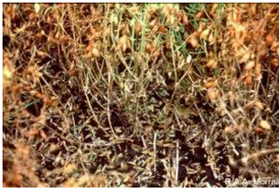
Figure 12 : Dégâts de la rouille chez la lentille

La rouille est une maladie assez fréquente chez les légumineuses et compte parmi les maladies principales de la lentille. Elle est affecte essentiellement les zones continentales à climat sec et chaud (optimum thermique aux environs de 21°C). Elle se développe à partir de la floraison.