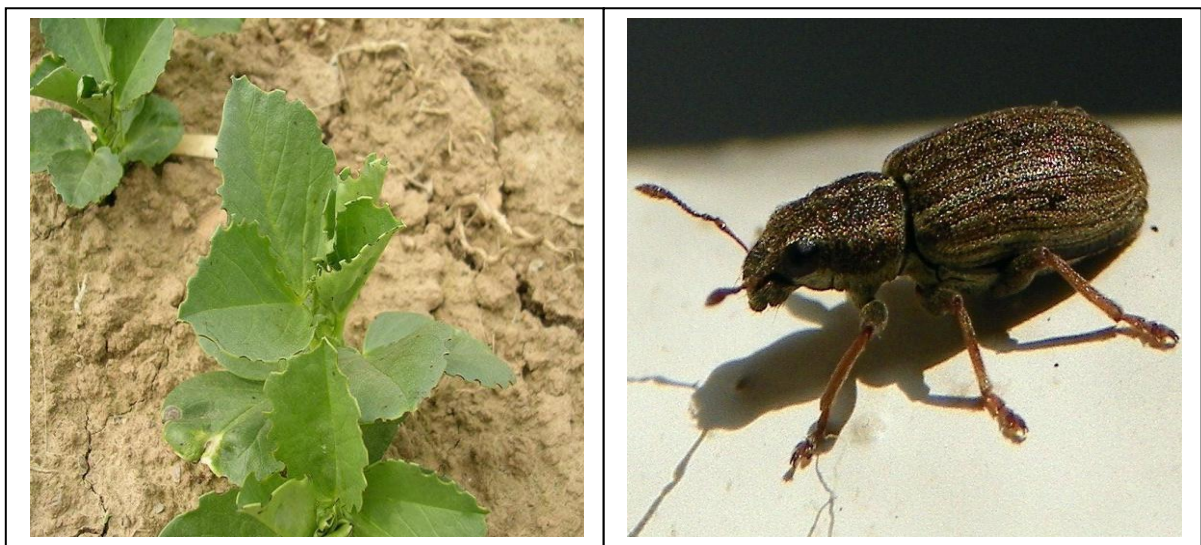
Figure 15 : Dégâts de Sitones sur féverole

Les plantes sont généralement sensibles aux attaques de sitones jusqu'au stade 6 feuilles. Une intervention insecticide est préconisée avant ce stade lorsque 5 à 10 morsures sont repérées sur les premières feuilles