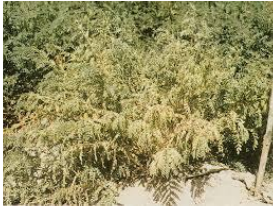
Figure 6 : Flétrissement total de la culture de pois chiche au champ