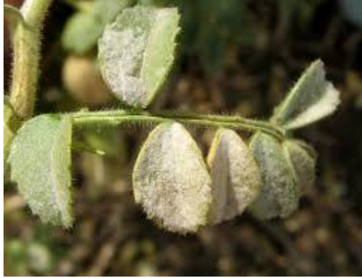
Figure 11 : Symptômes de l'oïdium sur le pois chiche