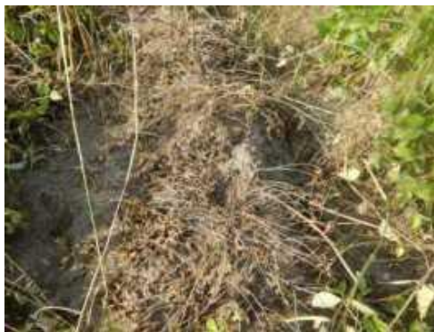
Figure 4 : Dégâts du Mildiou sur la culture de lentille

La maladie est favorisée par un climat humide (pluie, rosée, forte hygrométrie), peu ensoleillé, avec des températures comprises entre 1 et 18°C (optimum = 6°C). Elle est stoppée au delà de 20°C mais les températures comprises entre 15 et 20°C favorisent une abondante production d'oospores. Ces spores se conservent 6 à 10 ans dans le sol.