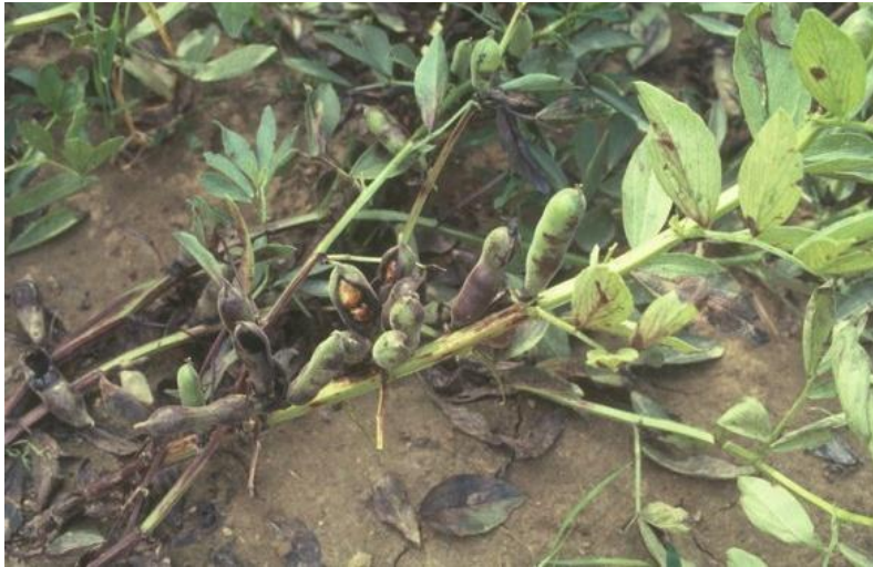
Figure 1 : Dommage de l'Ascochyose sur culture de fève