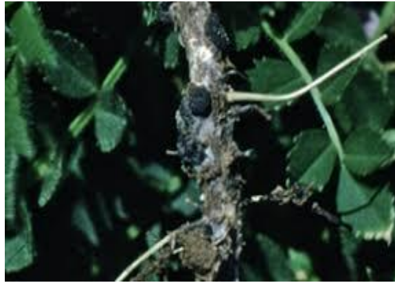
Figure 8 : Infestation avancée de la sclérotiniose sur pois chiche

Sur pois chiche, la maladie apparaît généralement à la floraison, sous forme de taches humides et irrégulières sur toutes les parties de la plante, et notamment sur les tiges. Un mycélium blanc et cotonneux se développe par la suite. A ce stade, la plante est bien souvent détruite. Des sclérotés de forme irrégulière, blancs puis noirs, apparaissent ensuite sur les parties touchées de la plante. Ils permettent au champignon de se conserver dans le sol pour une période allant de 8 à 10 ans. Leur taille est très voisine de celle d'un grain de pois.