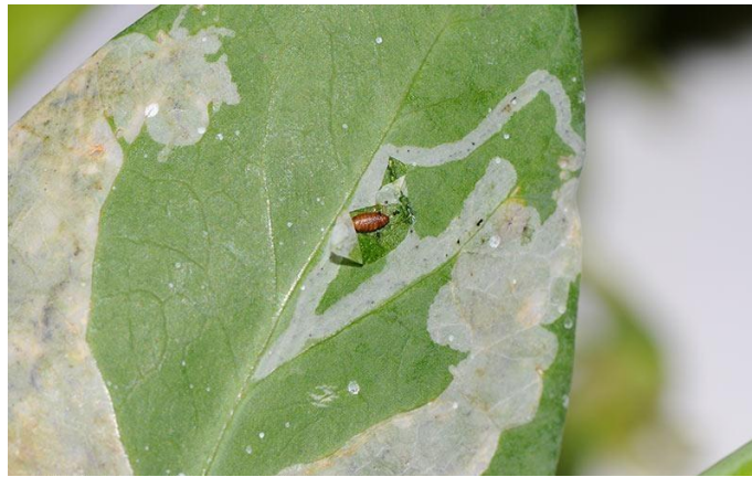
Figure 16 : Galerie causée par la mineuse de feuille au niveau de l'épiderme

Les feuilles attaquées par une mineuse brunissent, sèchent et finissent par tomber. Il en résulte un affaiblissement de la plante par défaut de photosynthèse. Il est rare que la plante parasitée soit détruite par les mineuses, mais elle devient plus sensible aux autres parasites et aux maladies cryptogamiques.