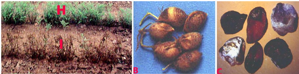
Figure 10 : Symptômes de l'antracnose sur pois chiche: symptômes sur (I) une rangée infectée, (H) rangée saine, (B) gousses et (C) graines

Les symptômes apparaissent sur toutes les parties aériennes de la plante: