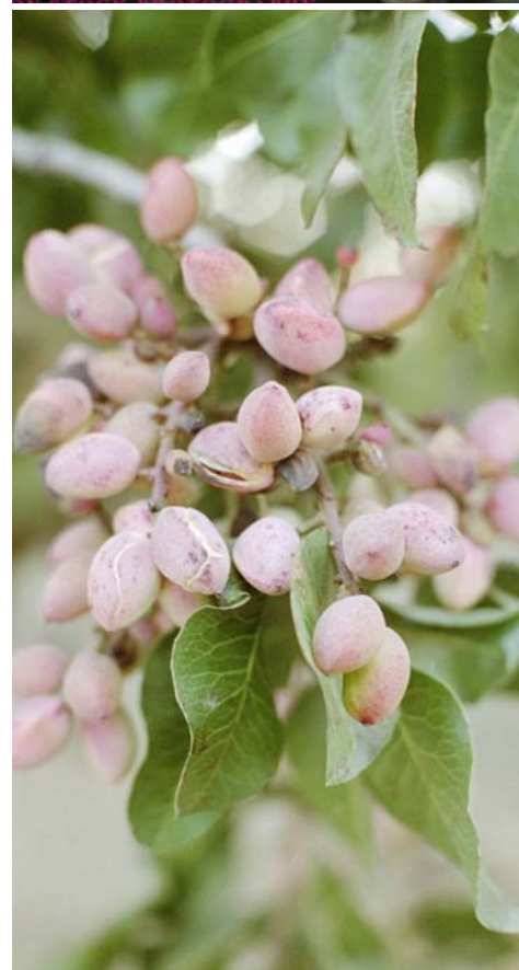
Tableau 1: Caractéristiques pomologiques des variétés de pistachier proposées pour la culture