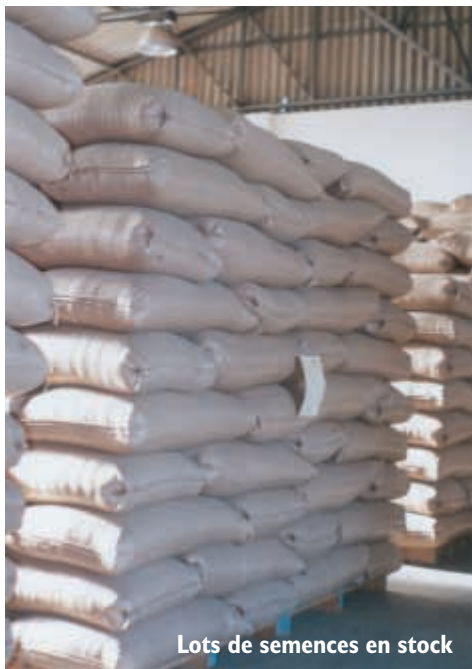
Lots de semences en stock

insectes, notamment les charançons qui sont les plus répandus.