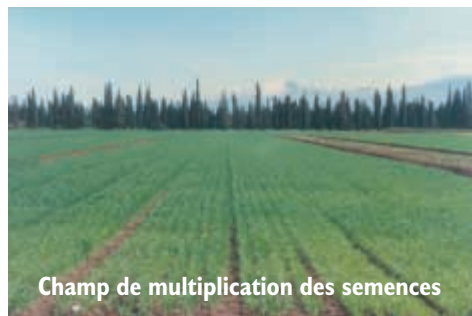
Champ de multiplication des semences

réalisées sous la responsabilité des sociétés grainières chez des agriculteurs multiplicateurs professionnels. Chaque génération exige des interventions particulières depuis l'installation au champ jusqu'à la commercialisation.